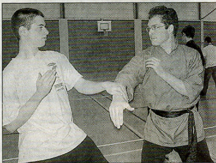
Le handi kung-fu est destiné à des personnes en situation de handicap et repose sur la pratique martiale des « poussées de mains ».

□ La méthode. Les deux partenaires sont symétriquement face à face, ils effectuent des mouvements de poussées de bras, de véritables antennes qui émettent et réceptionnent force, densité, intention de l'adversaire. L'apprentissage consiste à écouter, ressentir, interpréter, absorber puis parer les poussées de son adversaire par la seule et simple lecture des sensations que l'on ressent sur le bras.